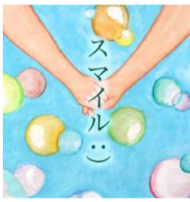
イラスト・中村一中美術部の皆さん

完成したCDはレコーディングに参加した子ども達と福島県内の公共施設等に贈られます。また「福島の子も笑顔」プロジェクト ( http://www.somajc.com/smile/ ) に寄付をいただいた方にもプレゼントされます。寄付金はその全額が相馬地方の子ども達のための事業に使用されます。問い合わせは、相馬青年会議所 (0244-36-4411) まで。